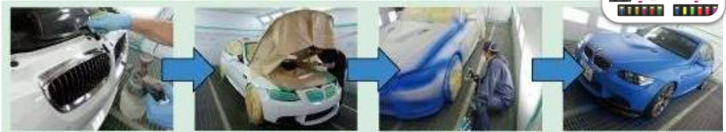
下地処理は洗車・脱脂のみ